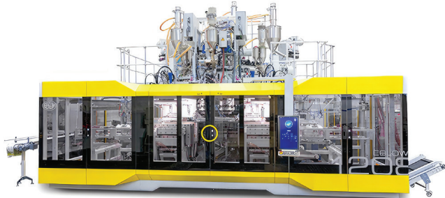
EBLOW 1208D (6-Layer Co-Ex)