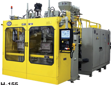
H-155 "EL CABALLO DE BATALLA DE LA INDUSTRIA"